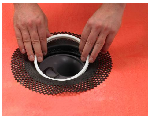
3. Montering af membranflange og klemring

For at sikre en god vedhæftning og dermed etablere en vandtæt samling ved gulv afløbet/slukken er det vigtigt at afløbets/slukens krave rengøres og affedtes.