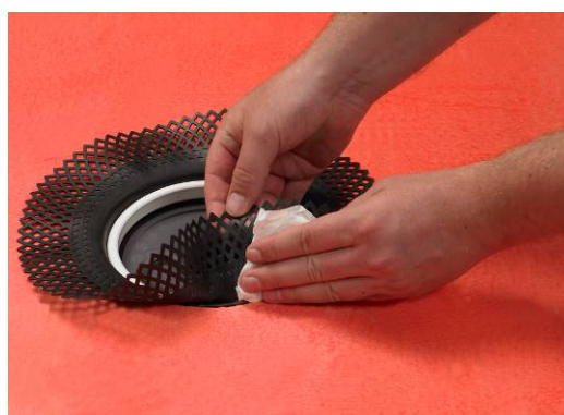
4. Rengør membranflange og affedt med f.eks. acetone