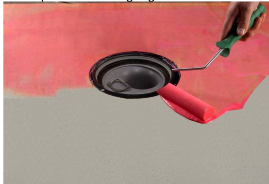
2. Primning af underlag.

Beton primes kun en gang med Alfix Primer fortyndet med vand 1:3.