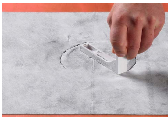
7. Skær hullet ud med Purus kniven.