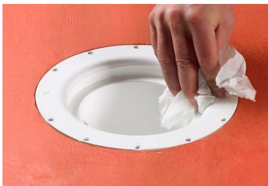
4. Rengør afløbets krave og affedt med f.eks. acetone.