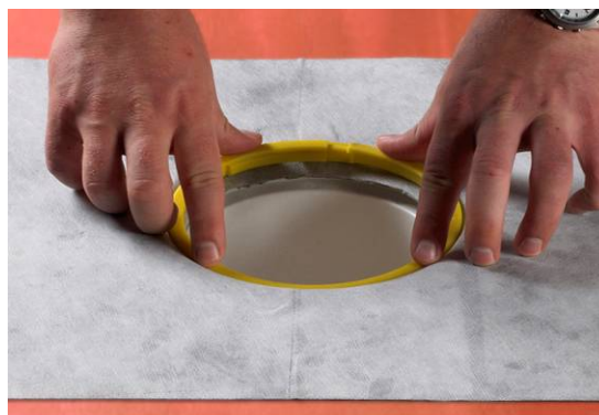
8. Montering af gul eller blå klemring.