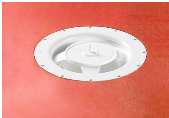
5. Montering af fod for Purus kniv.

Alfix Afløbsmanchet lægges først løst over afløbsskålen. For at fastgøre manchetten fjernes beskyttelsespapiret fra bagsiden. For at opnå det bedste resultat, bør man kun fjerne papiret fra halvdelen af manchetten og trykke den fast, før resten af papiret fjernes og montering kan færdiggøres.