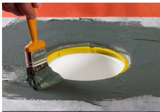
9. Påføring af Alfix Tætningsmasse.

Bemærk: Alternativt kan der i overgang mellem gulv og afløb/sluk monteres Alfix Armeringsvæv i tætningsmassen.