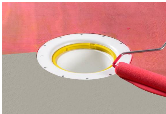
2. Primning af underlag.

Beton primes kun en gang med Alfix Primer fortyndet med vand 1:3.