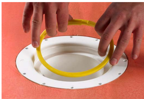
3. Fjern klemringen.

For at sikre en god vedhæftning og dermed etablere en vandtæt samling ved gulv afløbet/slukken er det vigtigt at afløbets/slukens krave rengøres og affedtes.