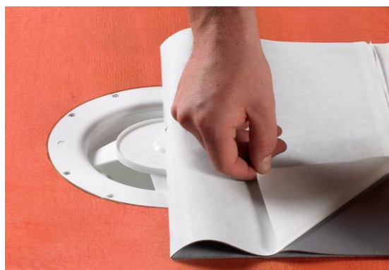
6. Montering af Alfix Afløbsmanchet.