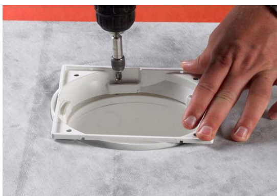
7. Montering af klinkeoverdel/klemring. Bemærk! Krydsspændes. Ingen O-ring.