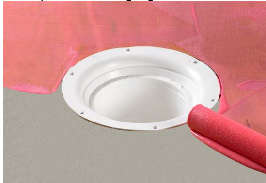
2. Primning af underlag.

Beton primes kun en gang med Alfix Primer fortyndet med vand 1:3.