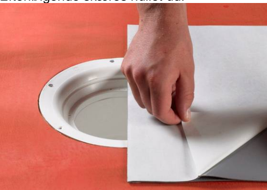
4. Montering af Alfix Afløbsmanchet.

Alfix Afløbsmanchet lægges først løst over afløbsskålen. For at fastgøre manchetten fjernes beskyttelsespapiret fra bagsiden. For at opnå det bedste resultat, bør man kun fjerne papiret fra halvdelen af manchetten og trykke den fast, før resten af papiret fjernes og montering kan færdiggøres. Efterfølgende skæres hullet ud.