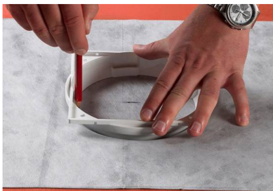
5. Markering af hullet.