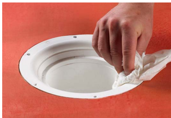
3. Rengør afløbets krave og affedt med f.eks. acetone.

For at sikre en god vedhæftning og dermed etablere en vandtæt samling ved gulv afløbet/slukken er det vigtigt at afløbets/slukens krave rengøres og affedtes.