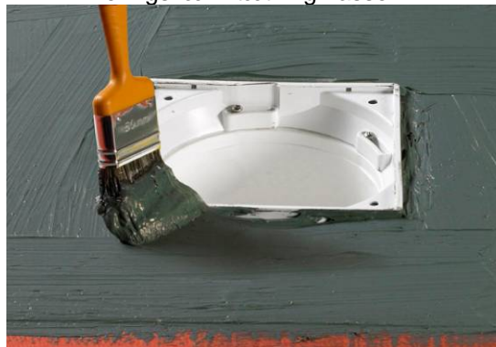
8. Påføring af Alfix Tætningsmasse

Bemærk: Alternativt kan der i overgang mellem gulv og afløb/sluk monteres Alfix Armeringsvæv i tætningsmassen.