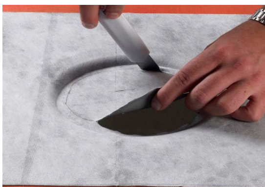
6. Skær hullet ud.